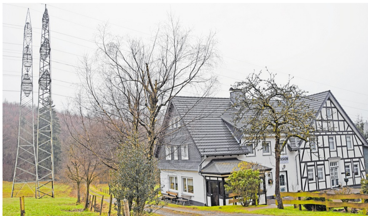
Die Pension Baumhoff im Apollmicke-Tal bei Oberveischede. Zwei Leitungen führen knapp am Gebäude vorbei, die dritte direkt darüber hinweg

Verkabelt wird allerdings nicht die künftige 380-kV-Leitung, sondern die 110-kV-Leitung von RWE-Westnetz. Zur Begründung sagt Amprion-Sprecher Claas Hammes: „Der Abschnitt Apollmicke stellt besondere Anforderungen bezüglich des angrenzenden FFH-Gebietes, des Artenschutzes und der Wohnbebauung. Auf einer Länge von ca. 1,6 Kilometern soll ein besonders schmales Trassenband mit niedrigen Masten entstehen. Daher wird in diesem Abschnitt die RWE-Westnetz 110-kV-Wechselstrom-Leitung als Erdkabel verlegt. Im Gegensatz zu 380-kV-Wechselstrom-Erdkabeln ist der Einsatz von